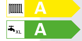
Condens 2500 W Yoğuşmalı Kombi