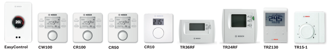
EasyControl CW100 CR100 CR50 CR10 TR36RF TR24RF TRZ130 TR15-1