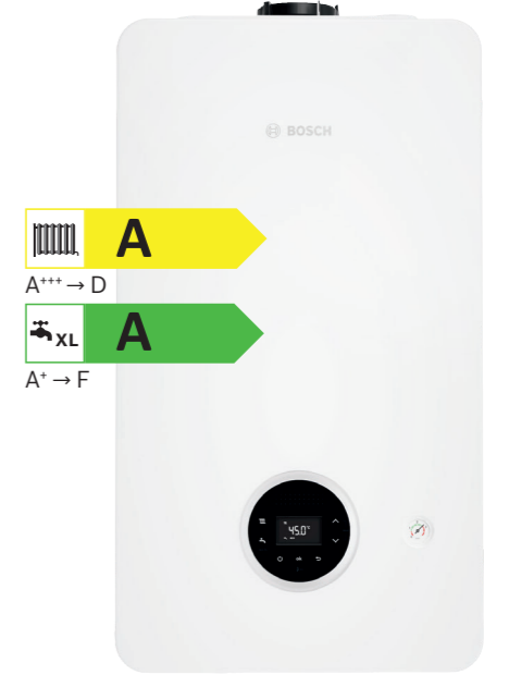
Condens 2200i W Yoğuşmalı Kombi